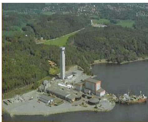
Le centre de compétence de Halden (Norvège)

Le second pilier sur lequel s'appuie l'approche de Nexans concerne les performances en matière de qualité, garanties par un souci constant d'innovation et de respect de l'environnement. Nexans réinvestit massivement dans la R&D afin développer en permanence de nouveaux produits pour l'industrie pétrolière et gazière. La recherche théorique est menée en étroite coopération avec les universités et les organismes internationaux dans des domaines tels que les polymères, les fibres optiques plastiques, les technologies exploitables par grands fonds, les matériaux sûrs et non polluants, etc. En parallèle, la recherche appliquée s'effectue au centre international de recherche de Nexans à Lyon. Une fois démontrée la faisabilité d'une technologie, la responsabilité de sa réalisation est confiée à l'un des centres de compétences répartis dans 10 pays.