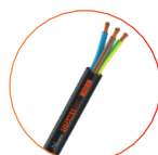
Nexans H07RN-F Titanex