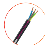
Nexans U-1000 R2V Distingo NX'Tag