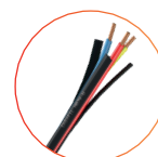
Nexans 3H07V-U Easyfil