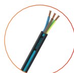
Nexans U-1000 R2V Distingo